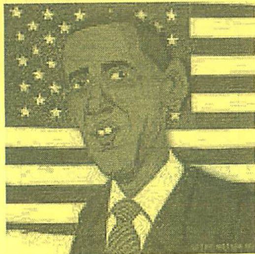
「核兵器のない世界を」署名をNYに オバマ大統領を本気にさせよう！！